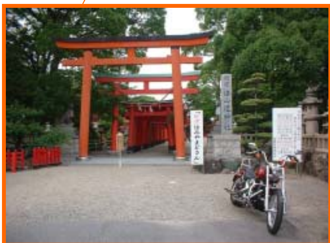
砂利が深いので車両の置く位置に注意