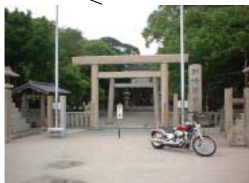
駐車場から別宮の鳥居とともに