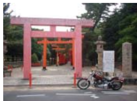
近鉄「海山道駅」前の鳥居 道が狭い為、撮影には注意