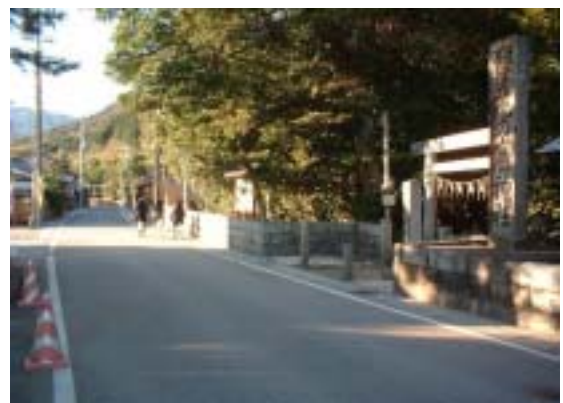
交差点に近くて道が狭い。 撮影時には注意が必要。