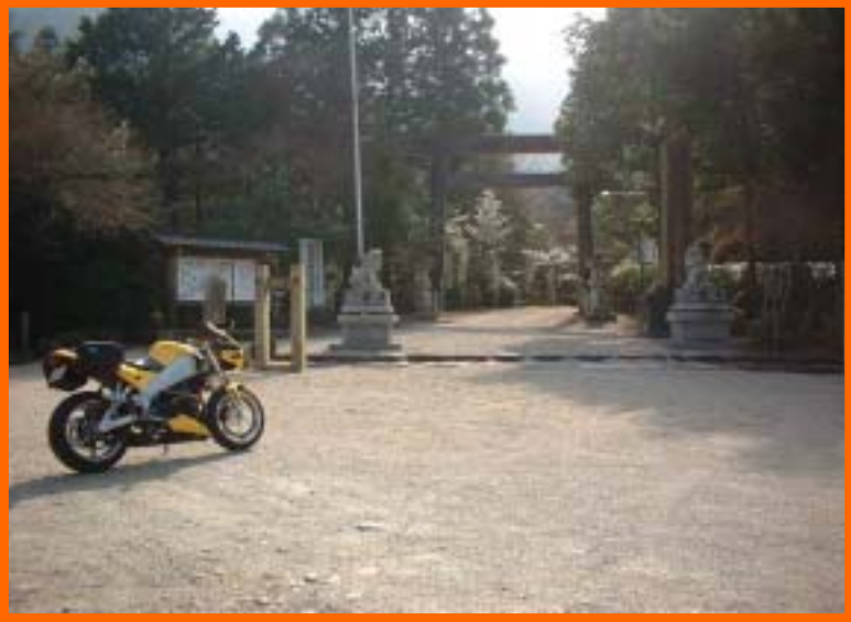
狛犬の前は砂利が深いので、 駐車の際は注意！