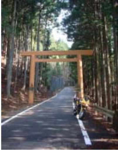
進入路、駐車場のだいぶ手前 道をまたいで鳥居がある