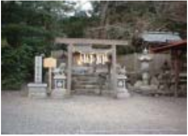
駐車場にある別宮